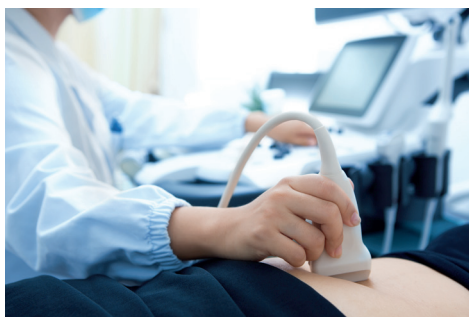
Preventief echo-onderzoek AAA-QuickScan

In de nieuwe Europese (2019)- en Nederlandse (2021) AAA-richtlijnen voor medisch specialisten wordt een AAA-QuickScan geadviseerd voor specifieke risicogroepen. Meerdere West Europese landen kennen al veel langer AAA-bevolkingsonderzoek en met name voor mannen vanaf 65 jaar. In Nederland wordt zo'n landelijke screening nog steeds niet van rijkswege gefaciliteerd.